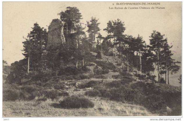
Les ruines de l'ancien Château de Mahun

Si les pierres pouvaient parler, elles nous raconteraient beaucoup d'histoires, celles des ruines du Chirat Blanc, celles du château des Pagans, seigneurs de Mahun. Du site protohistorique il reste des fonds de cabane, une voie d'accès, des portions de murailles et beaucoup d'interrogations. Du château de Mahun ne demeurent que deux pans de mur, fièrement dressés au-dessus du rocher qui donne son identité à la commune. Ces pierres nous raconteraient aussi l'histoire des maisons encore debout, maintes fois reconstruites ou agrandies, ainsi que celles des bâtiments disparus. Toutefois, les archéologues savent faire parler les pierres et le passé.