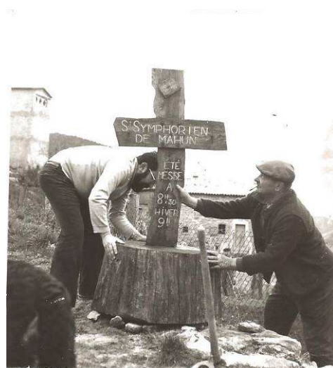
Croix à l'entrée du village

Mais St-Sym n'a pas toujours été à l'écart. La vallée du Nant et plus encore les crêtes étaient des lieux de passage, à une époque où les routes goudronnées n'existaient pas. Le Chirat Blanc a pu être un lieu de passage obligé, protégé par sa position. Au Moyen Âge, le hameau de Veyrines, siège d'un prieuré bénédictin, se situait sur un chemin muletier qui reliait la vallée du Rhône au Velay, l'actuelle Haute-Loire. Plus tard, on trouve mention d'une route royale, venant du château de la Faurie, à Saint-Alban-d'Ay, qui passait par le château de Mahun et rejoignait le col du Rouvey et par-delà encore le Velay. Plus récemment la généalogie permet de constater que de nombreuses familles de la commune ont des ancêtres originaires de la vallée de la Vocance, des communes de la montagne (Lalouvesc, Saint-Pierre-sur-Doux, Saint-André-en-Vivaraire, Rochepaule...) et... de la Haute-Loire. Les logiques de déplacement n'étaient pas les mêmes qu'aujourd'hui, le règne de l'automobile n'était pas encore arrivé. Par ailleurs les lieux-dits étaient reliés entre eux par des chemins entretenus et parcourus par les gens et le bétail.